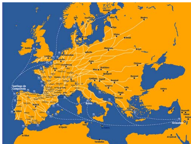
Пътеките към Сантяго де Компостела

различни свои измерения – на образователно, културно и оформящо характера преживяване.