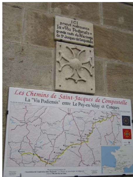
Информационна табела по пътя към Компостела, Puy-en-Velay

културни маршрути в Сантяго (ноември 2007), третото издание на фестивала – Моцарт, европеецът – инициран от музикалния университет в Манхайм и с участието на музикалните университети във Виена, Залцбург, Прага, Париж, Мюнхен и Милано (ноември-декември 2007).