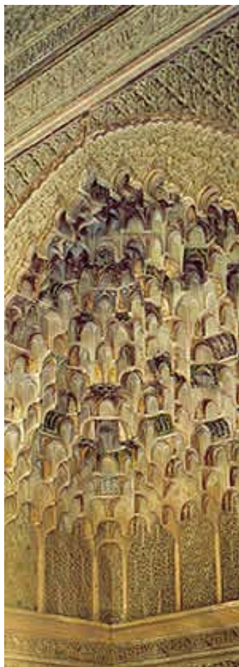
Заветите на Ал Андалуз

На тази логика са базирани изискванията дефинирани в приложението към Резолюцията за Културни маршрути на Съвета на Европа. За да получи сертификат Културен маршрут на Съвета на Европа, един културен маршрут трябва да притежава определени характеристики (фигура 1).