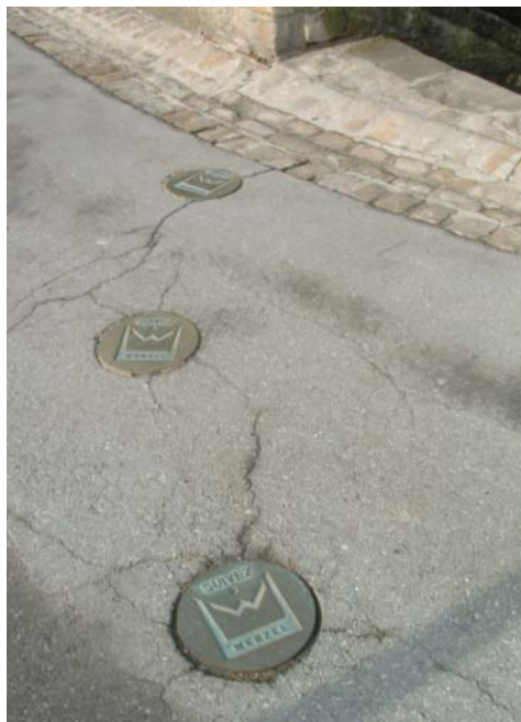
Европейски културен маршрут Венцел

Европейските културни маршрути днес са утвърдена ценност, която изявява споделеното европейско наследство, проследявайки историята на народи, миграциите и разпространението на европейската цивилизация. Те следват исторически пътища или (в определени случаи) съвременни комуникационни връзки в съответствие с целите на устойчивия културен туризъм.