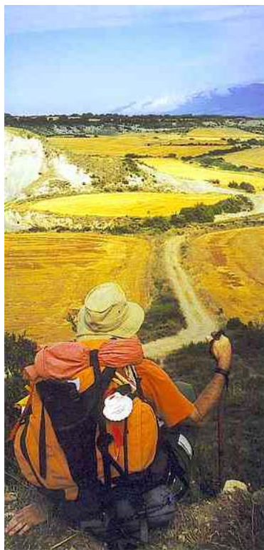
Пътят към Компостела

През 2007 и 2008 г. Европа чества 20-годишнината от първия европейски културен маршрут. Годишнината се отбелязва с редица културни прояви в различни европейски страни – една от тях е настоящият Форум в Пловдив - Трансбалкански културен коридор Гърция – България Румъния – споделено наследство и общо европейско бъдеще . Изминали са двадесет години на непрекъсната плодотворна практика за приложение на една важна европейска инициатива – лансирането на ПЪТЯ , като вид културно наследство и като инструмент за устойчиво регионално развитие.